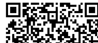
113-1基本素養-開課統整表